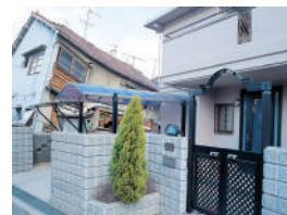
写真右:レスコハウス

現場打ちコンクリートより「軽い」「堅い」「強い」PCパネルは剛性が高く、地震による変形を抑えます。阪神・淡路大震災では、窓ガラス1枚の破損もありませんでした。