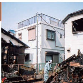
写真中央:レスコハウス