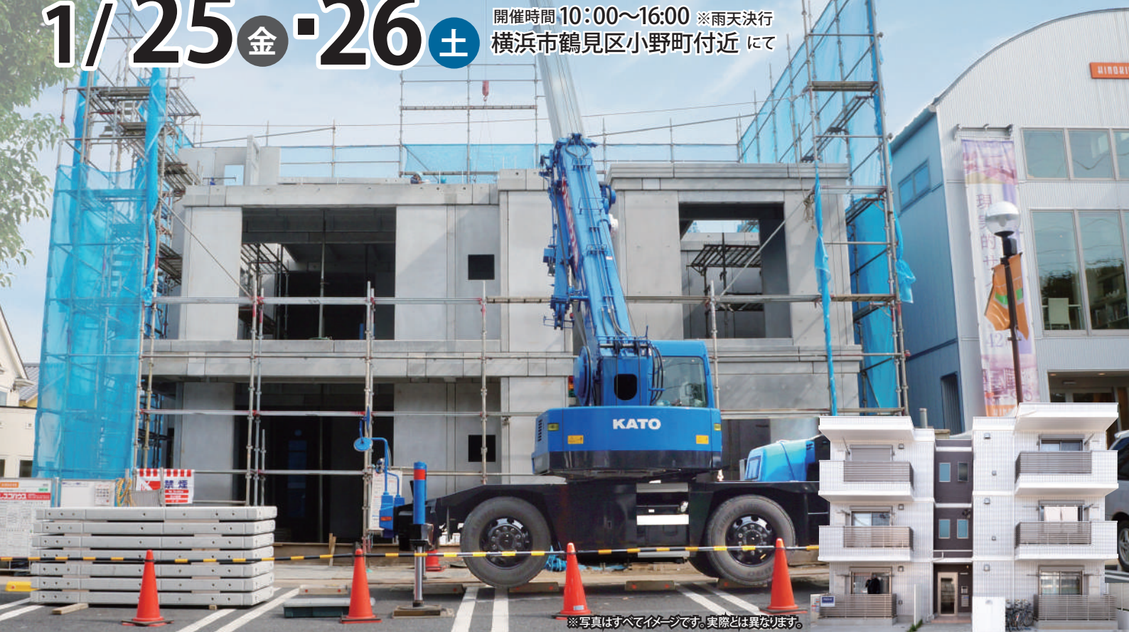
※写真はすべてイメージです。実際とは異なります。