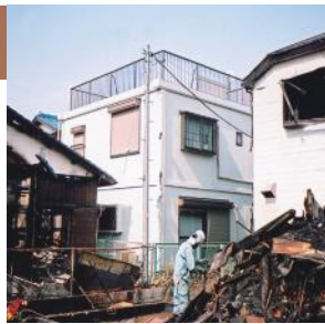
写真中央:レスコハウス