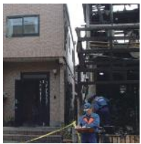
隣家火災 写真左:レスコハウス

PCパネルは燃えない建材。外部からの火災はもちろん、内側からの火にも強く、火災時のリスクを軽減できる数少ない建材です。