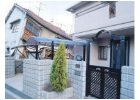
写真右:レスコハウス

現場打ちコンクリートより「軽い」「堅い」「強い」PCパネルは剛性が高く、地震による変形を抑えます。阪神・淡路大震災でも、窓ガラス1枚の破損もありませんでした。