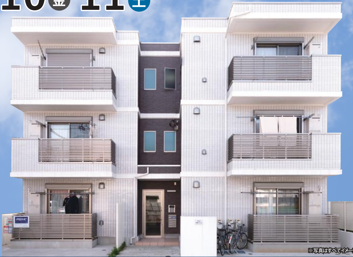
※写真はすべてイメージです。実際とは異なります。

開催時間 10:00~16:00 ※雨天決行 神奈川県横浜市中区本郷町3-201にて