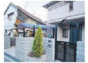
写真右:レスコハウス

現場打ちコンクリートより「軽い」「堅い」「強い」PCパネルは剛性が高く、地震による変形を抑えます。阪神・淡路大震災では、窓ガラス1枚の破損もありませんでした。