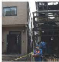
画像左:レスコハウス

PCパネルは燃えない建材。外部からの火災はもちろん、内側からの火にも強く、火災時のリスクを軽減できる数少ない建材です。