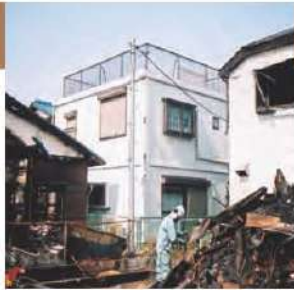
写真中央:レスコハウス