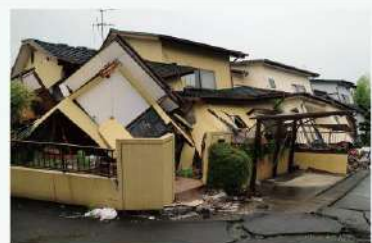
新耐震基準(耐震等級2)の木造住宅も倒壊