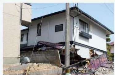
熊本地震では鉄骨プレハブ住宅も全壊