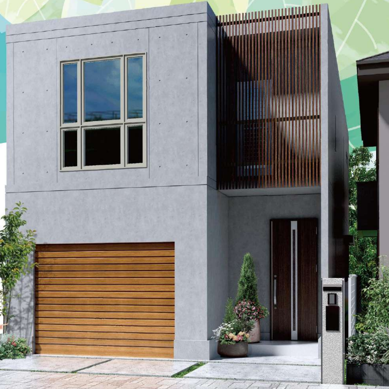
※写真はイメージとなります。開催会場とは異なります。