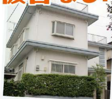
築35年のコンクリート住宅