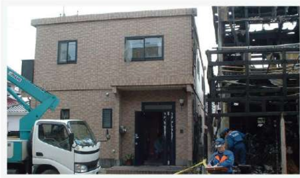
※1.5m離れた隣家での火災においても、雨樋以外ほとんど被害はありません。