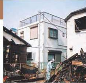
写真中央: レスコハウス