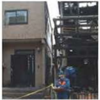
隣家火災 写真左: レスコハウス

PCパネルは燃えない建材。外部からの火災はもちろん、内側からの火にも強く、火災時のリスクを軽減できる数少ない建材です。