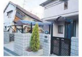
写真右: レスコハウス

現場打ちコンクリートより「軽い」「堅い」「強い」PCパネルは剛性が高く、地震による変形を抑えます。阪神・淡路大震災では、窓ガラス1枚の破損もありませんでした。