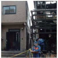
隣家火災 写真左:レスコハウス

PCパネルは燃えない建材。外部からの火災はもちろん、内側からの火にも強く、火災時のリスクを軽減できる数少ない建材です。