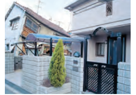
写真右:レスコハウス

現場打ちコンクリートより「軽い」「堅い」「強い」PCパネルは剛性が高く、地震による変形を抑えます。阪神・淡路大震災では、窓ガラス1枚の破損もありませんでした。