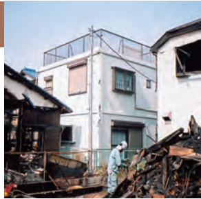
写真中央:レスコハウス