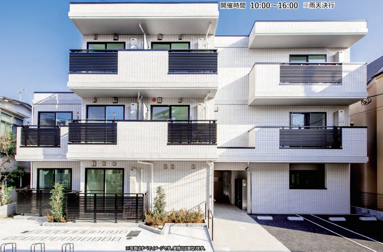
※写真はすべてイメージです。実際とは異なります。