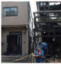
隣家火災 写真左:レスコハウス

PCパネルは燃えない建材。外部からの火災はもちろん、内側からの火にも強く、火災時のリスクを軽減できる数少ない建材です。