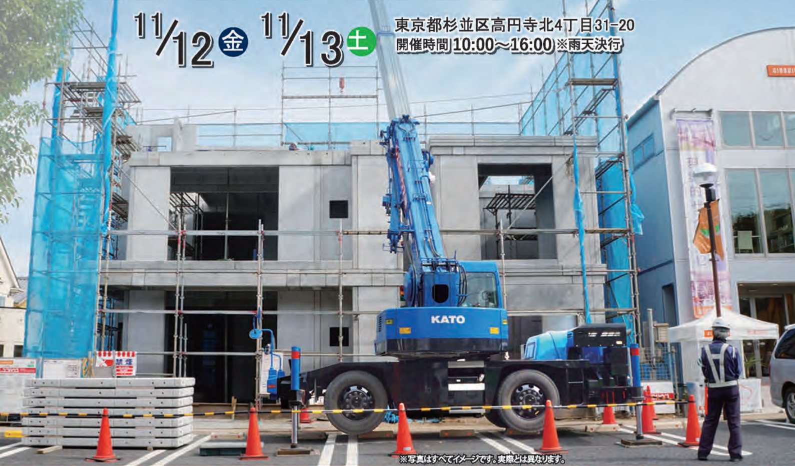
※写真はすべてイメージです。実際とは異なります。

東京都杉並区高円寺北4丁目31-20 開催時間 10:00~16:00 ※雨天決行