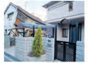
写真右:レスコハウス

現場打ちコンクリートより「軽い」「堅い」「強い」PCパネルは剛性が高く、地震による変形を抑えます。阪神・淡路大震災では、窓ガラス1枚の破損もありませんでした。