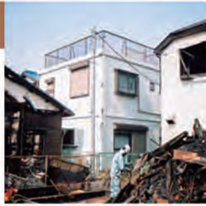
写真中央:レスコハウス