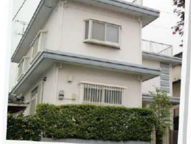
築35年のコンクリート住宅