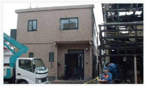
※1.5m離れた隣家での火災においても、両隣以外ほとんど被害はありません。