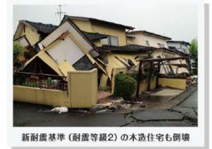
新耐震基準(耐震等級2)の木造住宅も倒壊