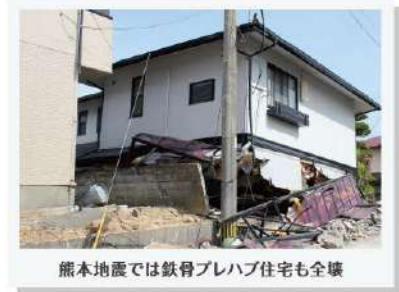
熊本地震では鉄骨プレハブ住宅も全壊